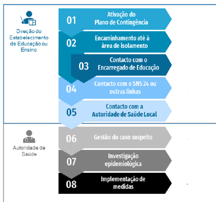
Fluxograma de atuação perante um caso possível ou provável de COVID-19 em contexto escolar