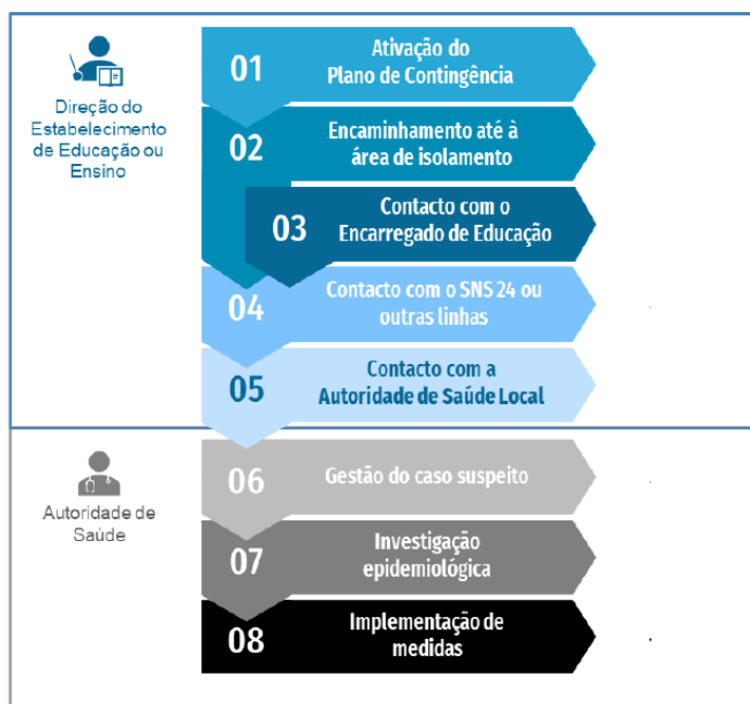
Fluxograma de atuação perante um caso possível ou provável de COVID-19 em contexto escolar