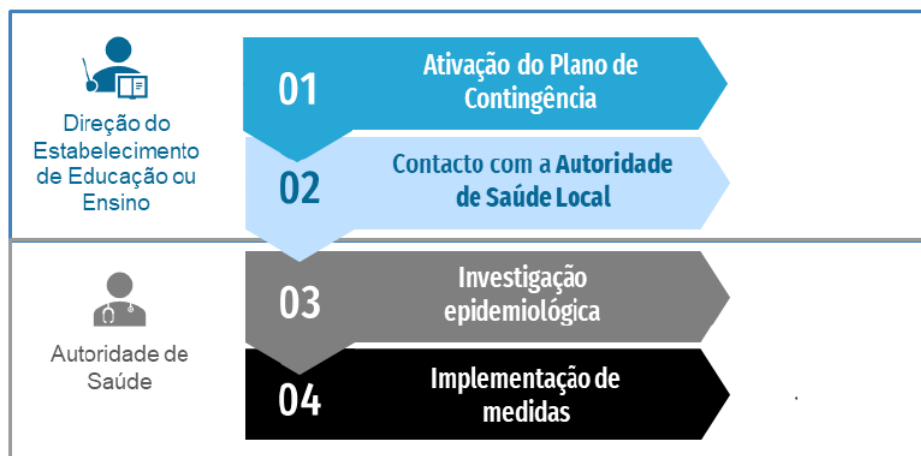
Fluxograma de atuação perante um caso confirmado de COVID-19 em contexto escolar