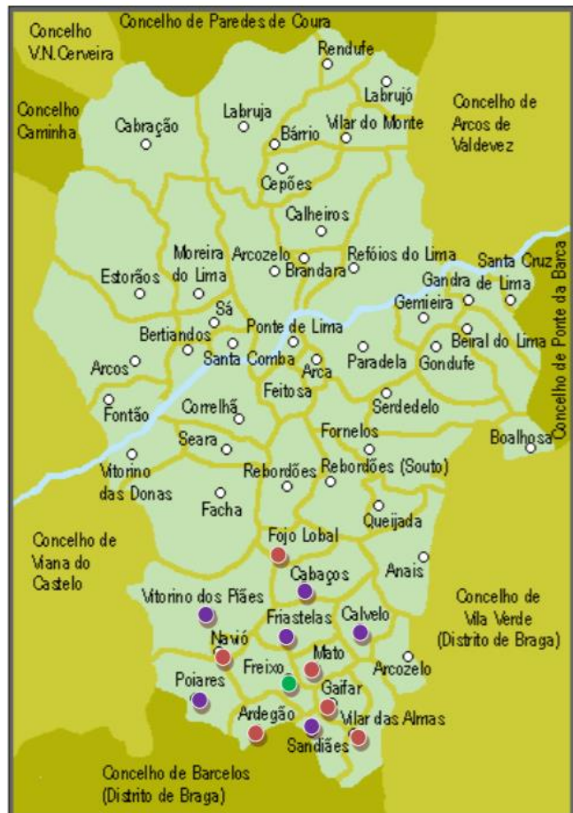
Figura 1: Concelho de Ponte de Lima e Freguesia de abrangência do Agrupamento de Escolas de Freixo

Nos últimos anos, verificou-se uma considerável redução do número de habitantes na área de abrangência do Agrupamento de Escolas de Freixo. Como consequência do anteriormente referido, o número de alunos deste Agrupamento sofreu também uma redução significativa. Comparando com o ano de 2011, todas as freguesias evidenciam uma perda de habitantes, correspondente a 11,4%.